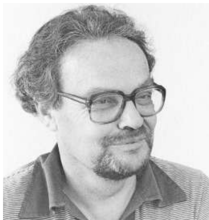
Als zufriedener Seminarlehrer in den 1970er-Jahren in Rorschach.