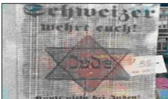
Photo 2: Affiche avec le slogan « Suisses, défendez-vous ! N'achetez rien aux Juifs » sur la porte d'un magasin juif à Bâle, le 10 novembre 2008.

En 2008, on a constaté une forte augmentation des messages antisémites sur Internet, y compris dans le cadre de forums électroniques de grands journaux. Suite aux événements au Moyen-Orient, de nombreux participants ont établi des comparaisons avec l'Holocauste, voire ont remis l'Holocauste en question, niant également le droit d'existence d'Israël. Cette tendance s'est renforcée en décembre 2008 et en janvier 2009.