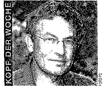
KOPF DER WOCHE

Dienstag, 12. Juli, 20 Uhr, Salle Mon Repos, Avenue Secrétan 2, Lausanne. www.coexistences.ch