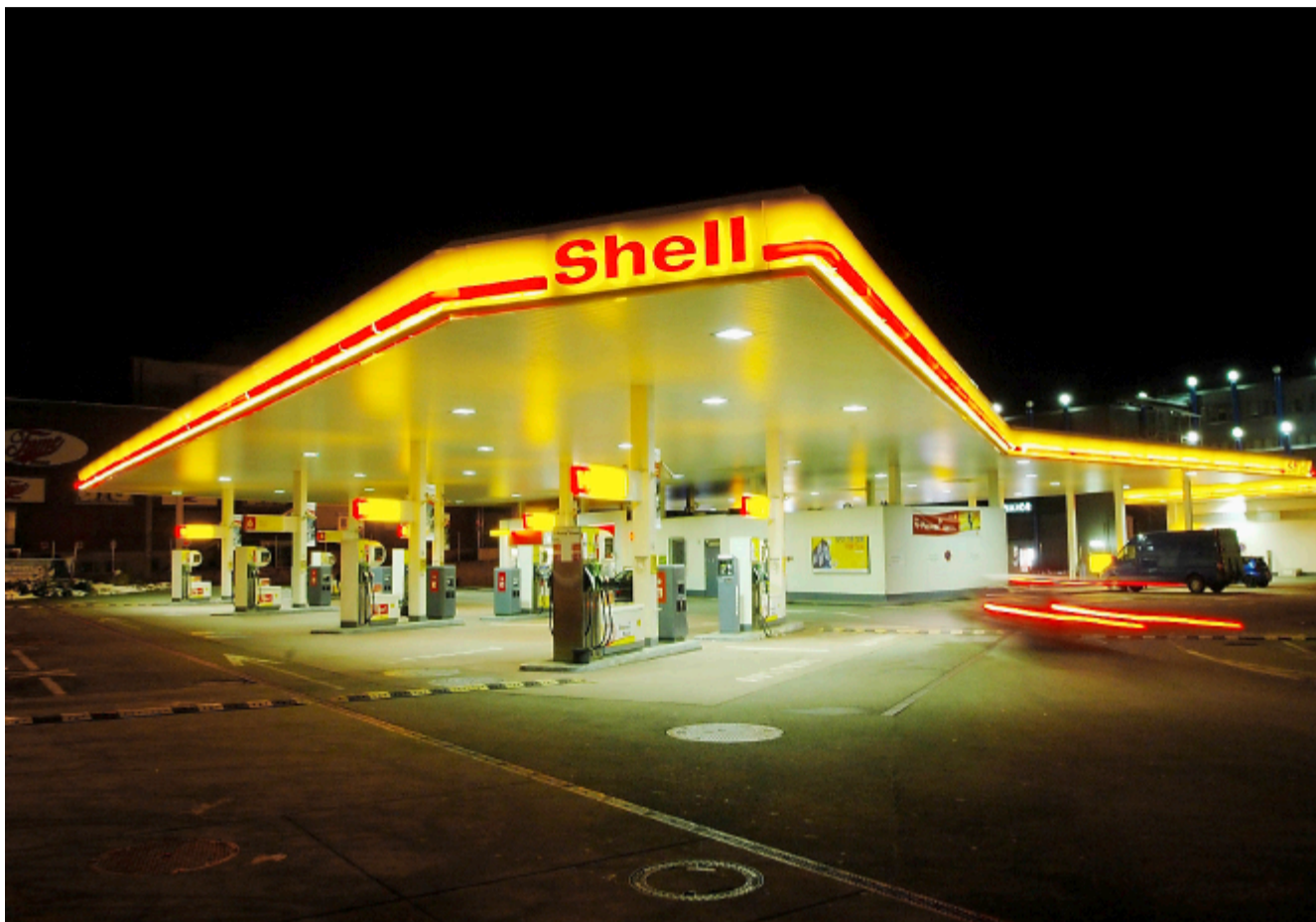
Das Angebot war «zu breit» und «zu tief»: Die Shell-Tankstelle beim Letzipark (2006).

Am Mittwoch wehrte sich der ehemalige Tankstellenbetreiber der damaligen Shell-Tankstelle Letzipark gegen die Busse. Er sollte 768 Franken bezahlen, weil er «als Betreiber des integrierten Kleinladens ein Warensortiment angeboten» hatte, «welches nicht überwiegend auf die spezifischen Bedürfnisse von Reisenden ausgerichtet war». Aufgrund «von Breite und Tiefe des Angebots muss gleichsam von einer Vollversorgung mit Gütern des täglichen Bedarfs eines durchschnittlichen Konsumenten ausgegangen» werden, heisst es in der Verfügung. Aufgezählt werden: Mindestens 7 Sorten tiefgefrorene Pizzas, 5 Sorten Pastasauce in Gläsern, 4 Sorten Fertig-Rösti, mehrere Reissorten, 9 Sekt-/Champagnersorten, 31 Sorten Wein, 12 Biersorten sowie 7 Sorten Wodka oder Wodkamischgetränke. Und