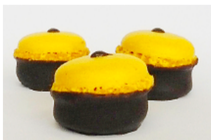
Luxemburgerli Grand-Marnier deluxe mit Buttercreme und Schokolade.

Das Oktober-Luxemburgerli ist aber ganz anders: Es besteht halb aus Creme und halb aus Makrönchen. Das gab es noch nie.