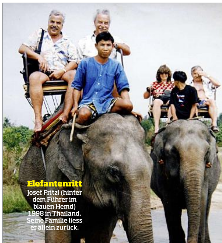
Elefantenritt Josef Fritzl (hinter dem Führer im blauen Hemd) 1998 in Thailand. Seine Familie liess er allein zurück.