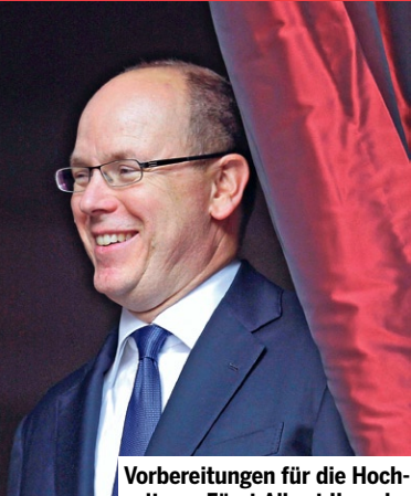
Vorbereitungen für die Hochzeit von Fürst Albert II. und Charlene Wittstock.