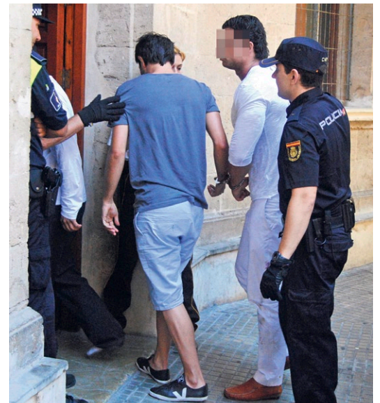
Der Boxer (in Weiss) wird verhaftet.

Der Schläger war in der betreffenden Nacht mit zwei Frauen an der Hafenterrasse von Palma unterwegs. Als eine Gruppe von Partygängern die Begleiterinnen anzüglich ansprach, drehte der tätowierte Hüne durch: Er attackierte willkürlich alle Passanten, die seinen Weg kreuzten, hob sie auf und schlug sie zu Boden. Erst ein Grossaufgebot der Nationalpolizei konnte ihn überwältigen. AMR