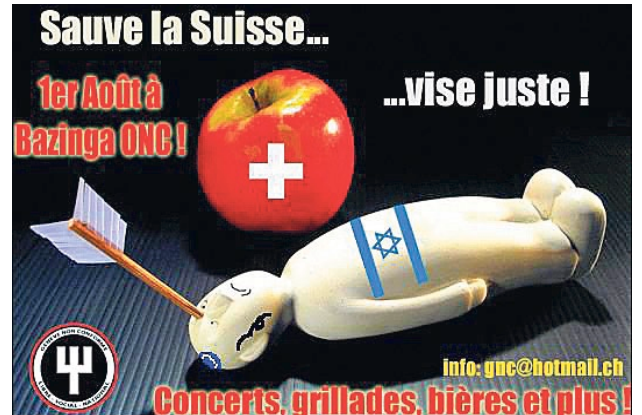
Mit diesem Flyer wirbt die GNC für ein 1.-August-Grillfest.