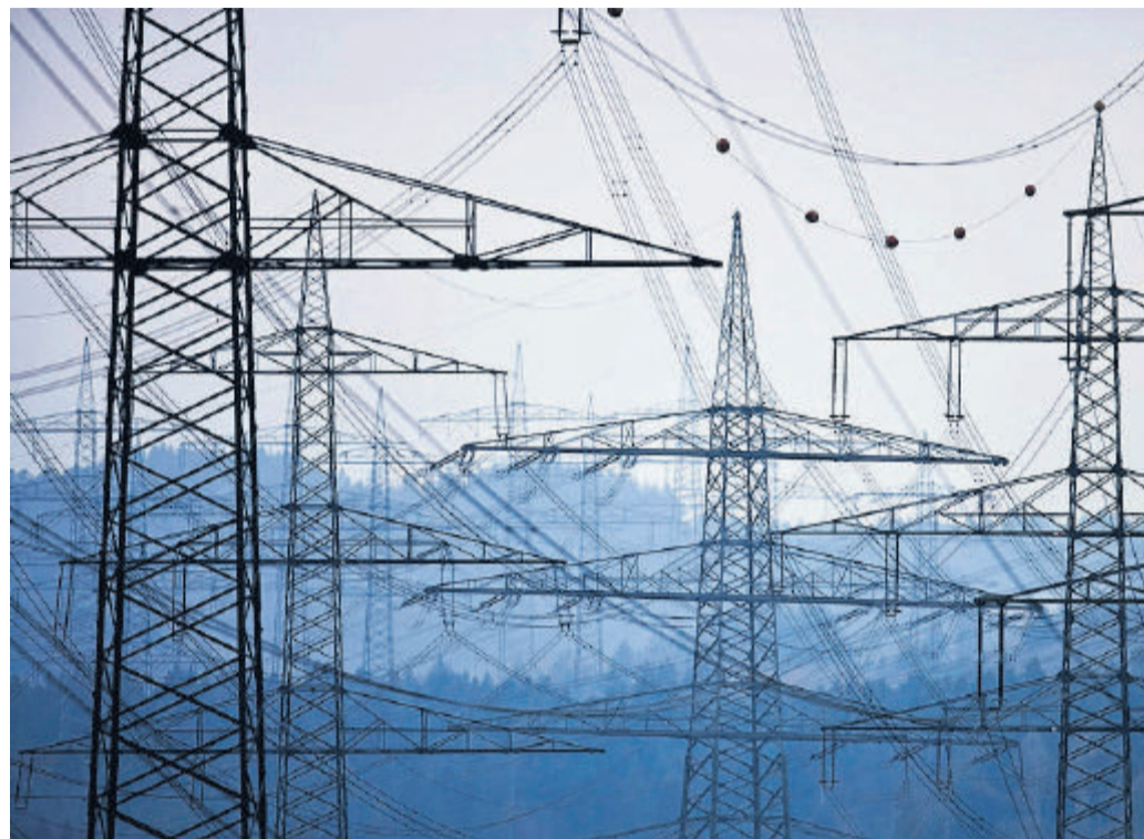
Strommasten im Mittland: Gefragt ist eine konsequente Effizienzstrategie.

● Mit zwei Motionen beauftragt der Nationalrat die Regierung, den Deckel der kostendeckenden Einspeisevergütung (KEV) zu beseitigen, um so mehr Geld in die Quersubventionierung von Biomasse-, Wind-, Solar- und kleinen Wasserkraftwerken zu pumpen. Damit erfüllt er eine alte Forderung sowohl der Solarlobby als auch der grünen Parteien. Doch die verstärkte Nutzung der unvorhersehbar anfallenden Wind- und Solarkraft kann die Stromversorgung nur sichern, wenn sie mit ebenso teuren wie umstrittenen Netzausbauten und Reservekraftwerken gekoppelt wird.