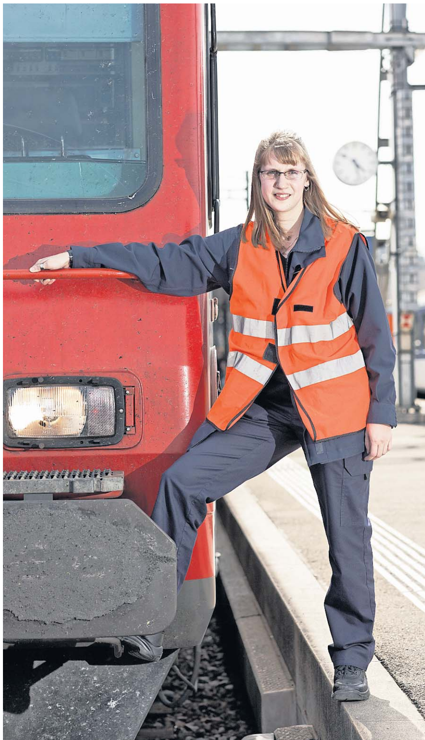
Diese junge Lokomotivführerin hat keine Probleme mit dem BMI.