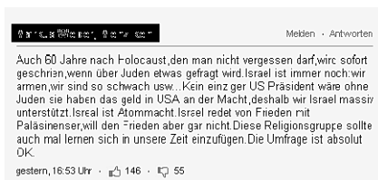
Leserkommentar auf Newportal

so der Geistliche. Indem er behauptet, dass «die Juden heute noch schlimmer seien als damals die Nazis», betreibt er eine Täter-Opfer-Umkehr und verharmlost die Verbrechen der Nationalsozialisten. Dennoch behauptet er, dass «kritische Reaktionen (auf die israelische Politik) nichts mit Antisemitismus zu tun haben».