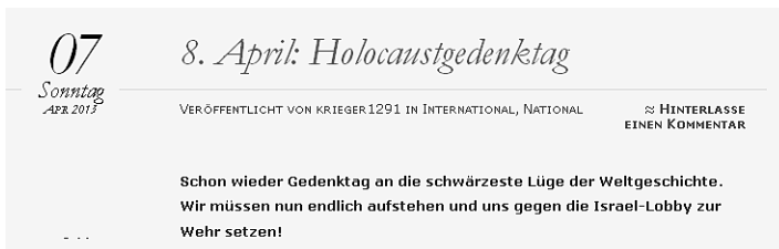
Antisemitischer Artikel auf rechtsextremer Website