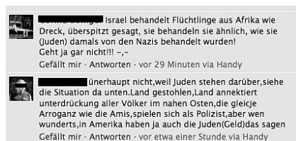
Antisemitische Posts auf Facebook